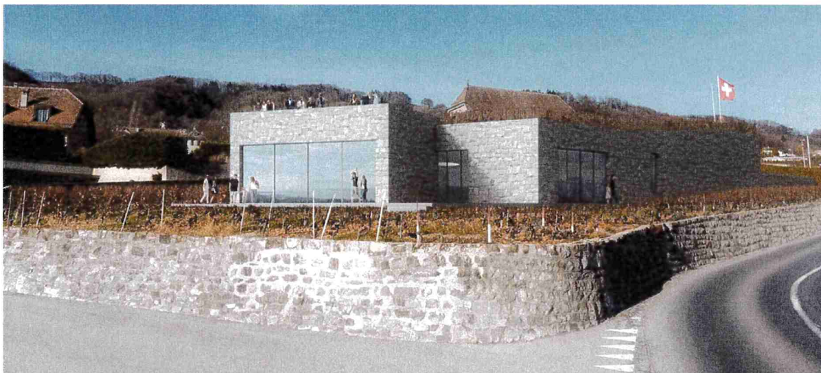
Plan du bâtiment en annexe

La cuisine, l'atelier de dégustation et la salle de séminaire seront des lieux animés dédiés aux savoir-faire et traditions locaux : initiation à la dégustation, atelier de cuisine du terroir, goûter du vigneron et autres événements proposés au fil des saisons.